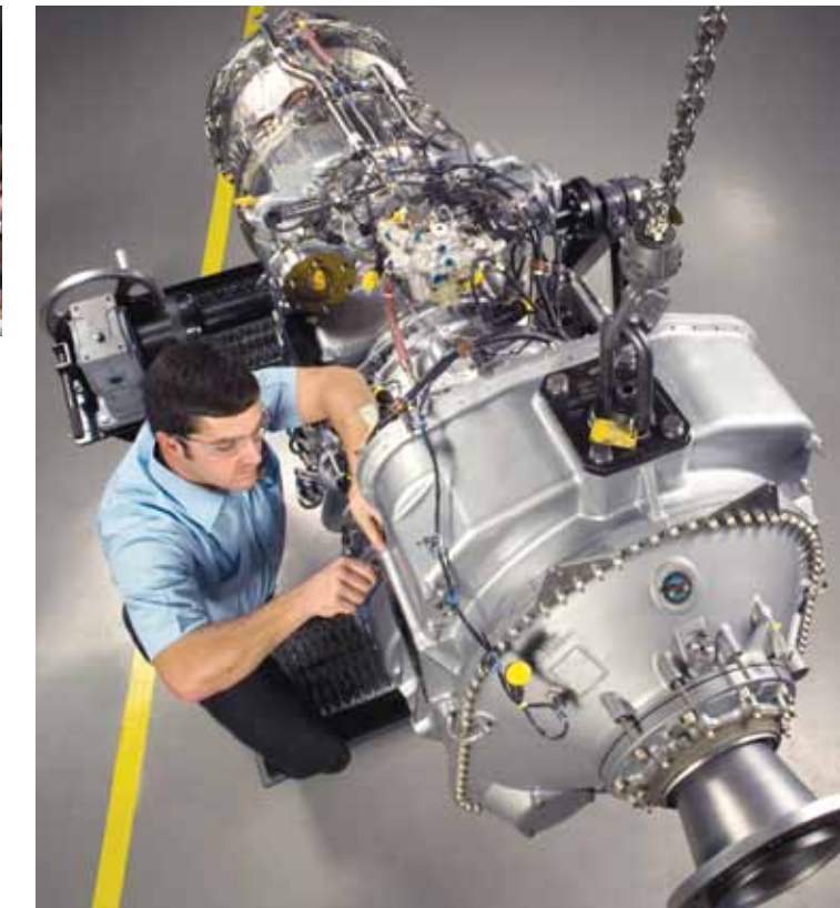
► Pratt & Whitney, Longueuil

Chef de file de la nouvelle économie, le Grand Montréal est l'un des principaux pôles d'innovation en Amérique du Nord de par la spécificité de sa structure industrielle très diversifiée et articulée autour de grappes de haute technologie telles que l'aérospatiale, les sciences de la vie et technologies de la santé, les technologies de l'information et des communications et les technologies propres.