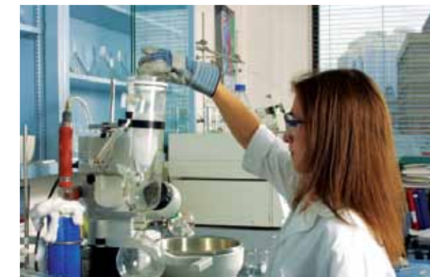
► Centre de recherche, Montréal

Le Grand Montréal se hisse au 1 er rang au Canada pour le nombre de centres de recherche à but non lucratif et de chercheurs universitaires, ainsi que pour les sommes investies en recherche universitaire. La région affiche en outre une concentration d'emplois en haute technologie comparable à celle de grands centres urbains américains tels que Dallas, San Diego et San Francisco, soit près d'un emploi sur dix.