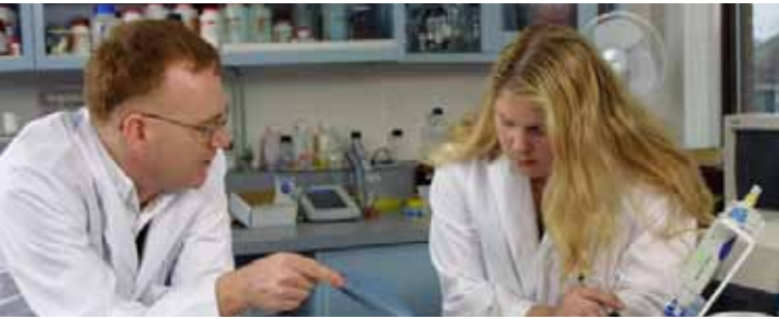
► Laboratoire, Montréal