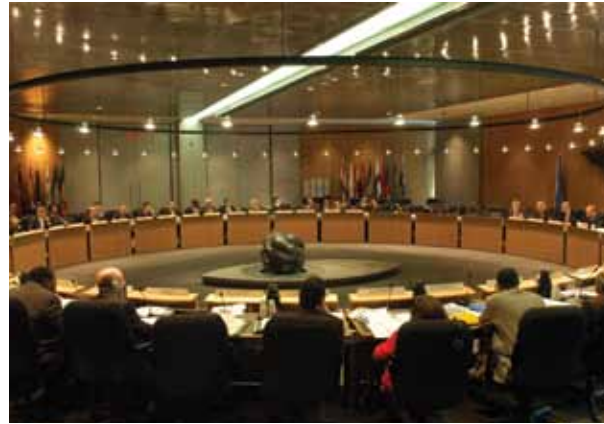
► Organisation de l'aviation civile internationale (OACI), Montréal

Voilà pourquoi près de 70 organisations internationales gouvernementales et non gouvernementales ont choisi de s'établir à Montréal.