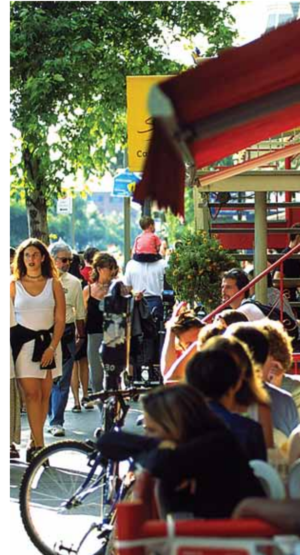
► Rue Saint-Denis, Montréal

Réputée mondialement pour la richesse et la diversité de son offre culturelle et artistique, Montréal est le lieu de rendez-vous par excellence des amateurs d'art, de musique, de danse, de théâtre, de cirque, de cinéma et de fine gastronomie.