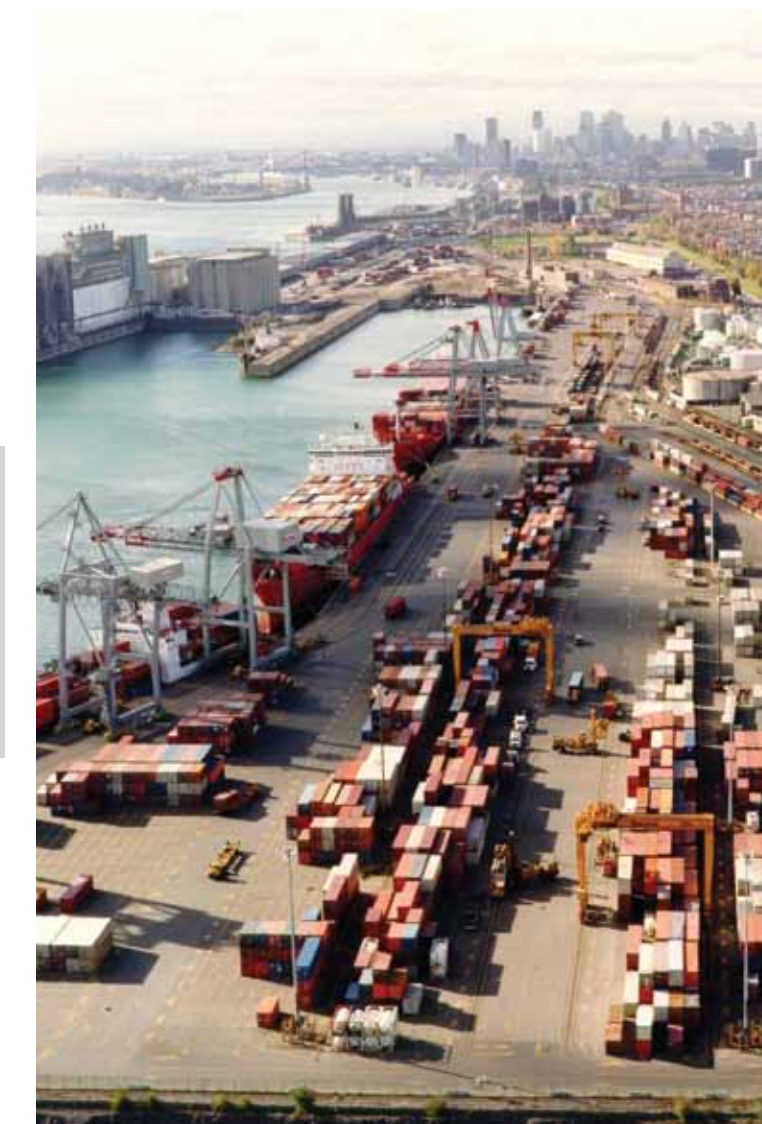
▶ Port de Montréal