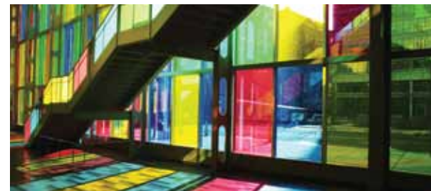
► Palais des congrès de Montréal

Montréal est une ville-hôte de premier choix, tant sur le plan de la qualité que des coûts, pour les rencontres internationales en Amérique du Nord. Au 3 e rang après New York et Washington pour le nombre de réunions internationales, Montréal se démarque notamment par son vaste éventail d'espaces de réunions et de lieux d'hébergement. Situé en plein cœur du quartier des affaires, le Palais des congrès de Montréal peut accueillir des événements d'envergure – jusqu'à 30 000 personnes. Il propose des services d'appui spécialisés et personnalisés aux organisations qui souhaitent tenir un congrès ou un événement international à Montréal.