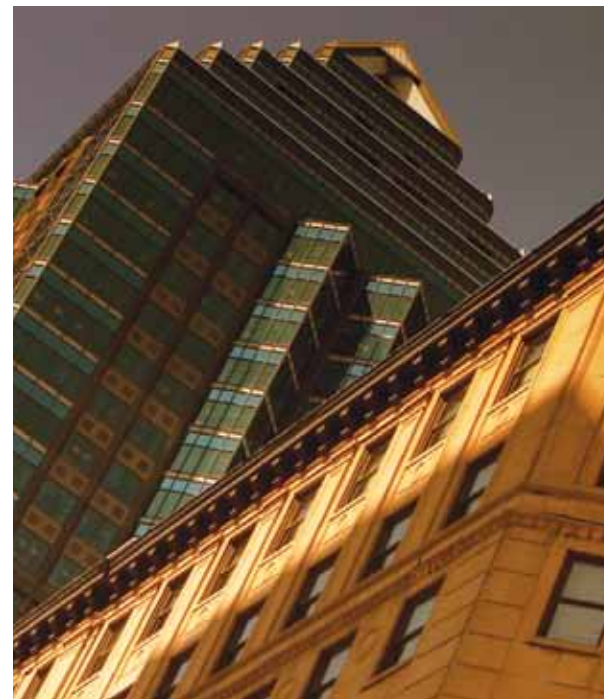
► Centre-ville de Montréal

La région métropolitaine de Montréal offre des espaces de bureau et industriels à des coûts extrêmement concurrentiels. Elle se classe d'ailleurs au 1 er rang des plus grandes agglomérations du Canada et des États-Unis pour la compétitivité des coûts totaux d'occupation d'un espace de bureau.