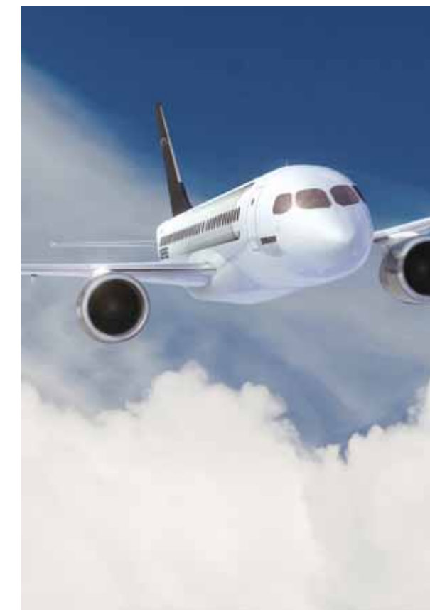
▶ CSeries, Bombardier

Le Grand Montréal figure parmi les trois pôles mondiaux de l'aérospatiale, avec Seattle et Toulouse. La région regroupe la presque totalité de la production aérospatiale québécoise et près de 60 % de la production totale canadienne.