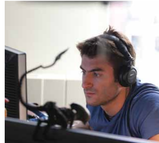
► Ubisoft, Montréal