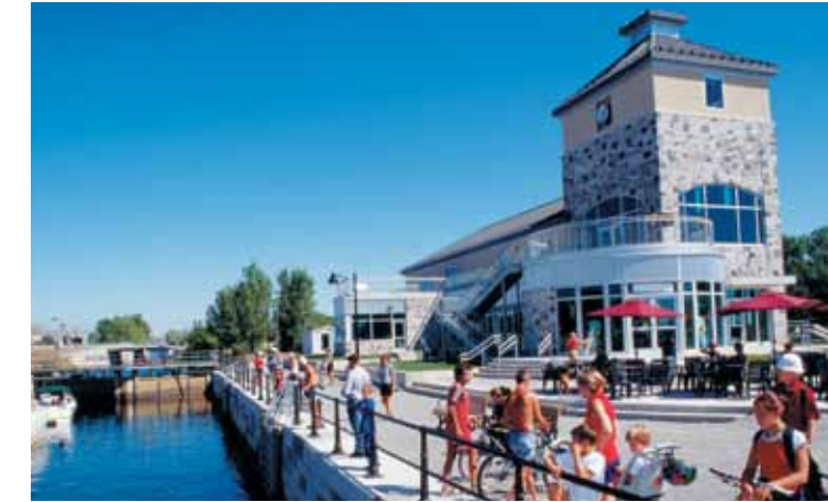
► Canal Lachine, Montréal