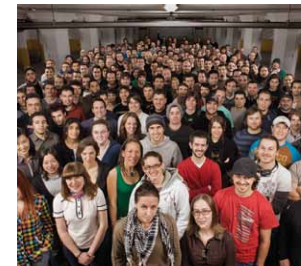
► Ubisoft, Montréal

En 2010, au sortir du ralentissement économique mondial, l'emploi total dans le Grand Montréal a augmenté de 2,8 %, permettant ainsi à la métropole québécoise de se classer au 2 e rang des grandes villes nord-américaines à ce chapitre.