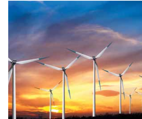
► Parc éolien, Québec

Démontrant un dynamisme remarquable, l'industrie de la transformation agroalimentaire se classe au 2 e rang des secteurs manufacturiers dans la région métropolitaine de Montréal pour le nombre d'emplois.