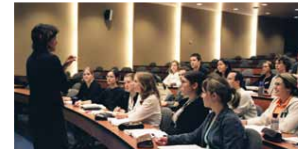
► Université de Montréal