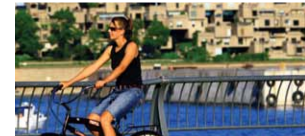
► Habitat 67, Montréal

Montréal est une ville verte où espaces urbains et espaces verts s'harmonisent, du Mont-Royal aux rives du fleuve St-Laurent. On s'y déplace aisément à pied, en voiture, par transport en commun ou en Bixi, le vélo en libre-service.