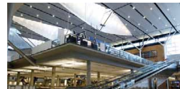
▶ Aéroport Montréal-Trudeau

Le port de Montréal, relié à plus de 100 pays dans le monde, offre la liaison la plus directe entre l'Europe et le cœur industriel de l'Amérique du Nord.